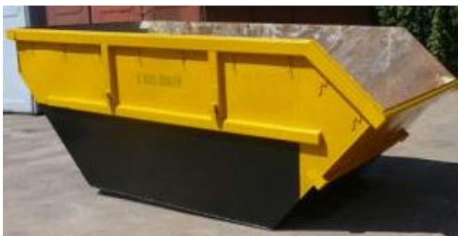
2 pav. Statybinių šiukšlių konteinerio pvz.

Baigus statybos darbus, aikštelėje esantis inventorių ir likę nepanaudoti statybos produktai išvežami, atliekama sklypo rekultivacija.