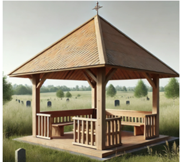
4 pav. Pavėsinės pavyzdys