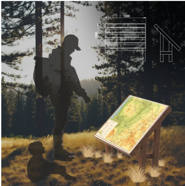
5 pav. Informacinio stendo pavyzdys