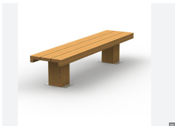
Mediniai lauko suoliukai: MI.S-MK-003