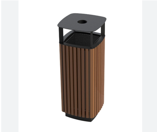
3 pav. Šiukšlių dėžės pavyzdys