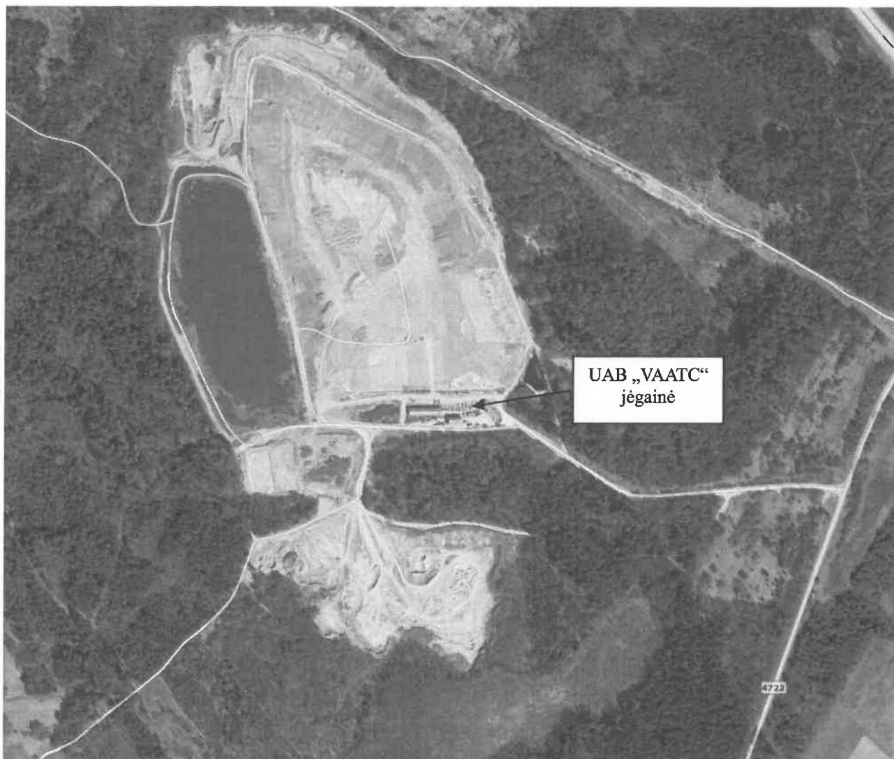
1 pav. Situacijos planas

UAB „VAATC“ eksploatuoja Kariotiškių sąvartyno dujų surinkimo ir utilizavimo, paverčiant jų energiją į naudingą elektros energiją, jėgainę. Jėgainė pastatyta uždaryto Kariotiškių sąvartyno teritorijoje. Sąvartyno sklypas išnuomotas UAB „VAATC“ iki 2027 m.