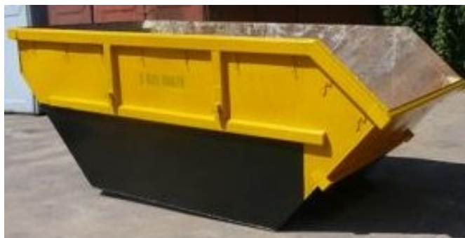
2 pav. Statybinių šiukšlių konteinerio pvz.

Baigus statybos darbus, aikštelėje esantis inventorių ir likę nepanaudoti statybos produktai išvežami, atliekama sklypo rekultivacija.