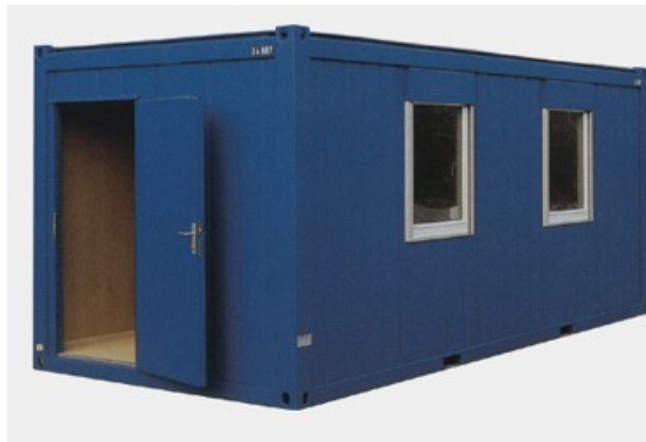
1 pav. Laikinos buitinės patalpos pvz.

Įrengiamos laikinos buitinės patalpos: statybos vadovo patalpa, buitinės patalpos darbininkams, biotualetai, pasitarimų patalpa, apsaugos postas ir ratų plovimo punktas (turi būti naudojama uždaro ciklo ratų plovimo sistema) prie įvažiavimo į statybietės teritoriją. Būtina įrengti administracines – buitines patalpas vadovaujantis normomis vienam dirbančiajam: statybos vadovui (inžinieriui) – 5 m 2 , drabužinės – 1,13 m 2 , prausyklos – 0,26 m 2 , džiovinimo patalpos – 0,2m 2 , valgymo-poilsio patalpos – 1m 2 , sušilimo patalpos – 0,1m 2 (bet ne mažesnė nei 8m 2 ), tualetai – 1 unitazas 30-čiai žmonių (1,2x0,8 m).