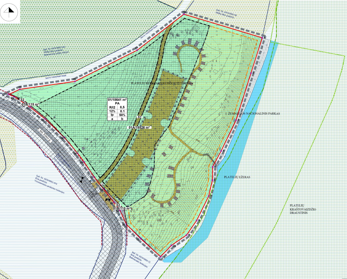
Štrauka iš 2018-07-26 Plungės rajono savivaldybės tarybos sprendimu Nr. T1-150 patvirtinto Plungės rajono savivaldybės teritorijos bendrojo plano koregavimo, žemės naudojimo ir apsaugos reglamentų brėžinio