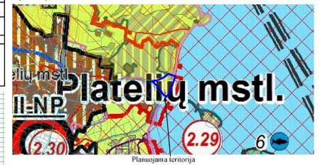
Štrauka iš 2024-03-28 Plungės rajono savivaldybės tarybos sprendimu Nr. T1-74 patvirtinto Plungės rajono savivaldybės teritorijos bendrojo plano kėlimo pagrindinio brėžinio