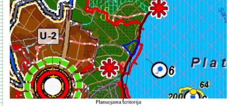
Štrauka iš 2014-10-23 LR Vyriausybės nutarimu Nr. 1148 patvirtinto Žemaitijos nacionalinio parko planavimo schemos (ribų ir tvarkymo planų)