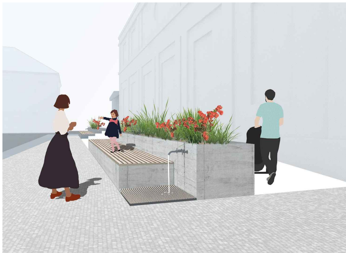
ILIUSTRACIJA Nr 1. "Turgaus halės laiptai"