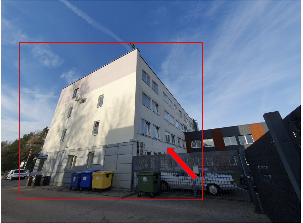
Fotonuotrauka Nr. 3 Remontuojamas Administracinis pastatas (unikalus Nr. 5197-5008-3020), S. Daukanto g. 19, Kazlų Rūdoje, pažymėtas raudonu kontūru. Vaizdas iš pietrytinės pusės nuo įvažiavimo į vidinį kiemą.