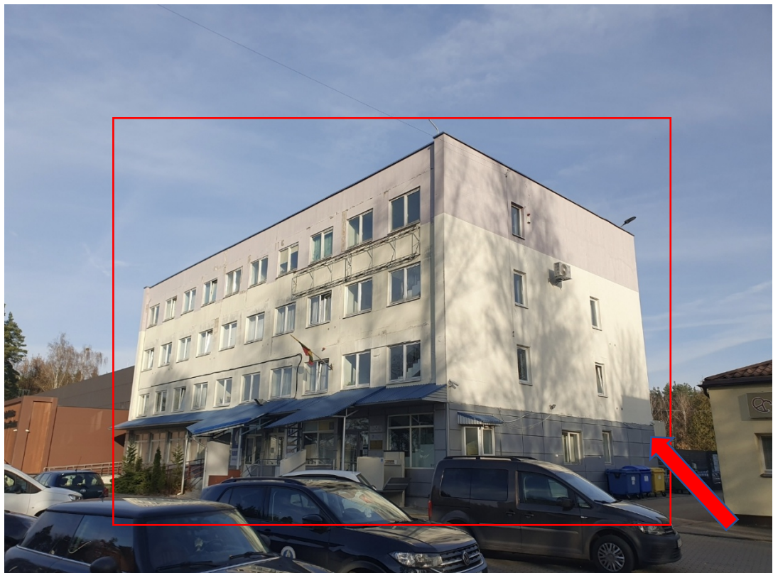
Fotonuotrauka Nr. 2 Remontuojamas Administracinis pastatas (unikalus Nr. 5197-5008-3020), S. Daukanto g. 19, Kazlų Rūdoje, pažymėtas raudonu kontūru. Vaizdas iš pietvakarinės pusės nuo S. Daukanto gatvės.