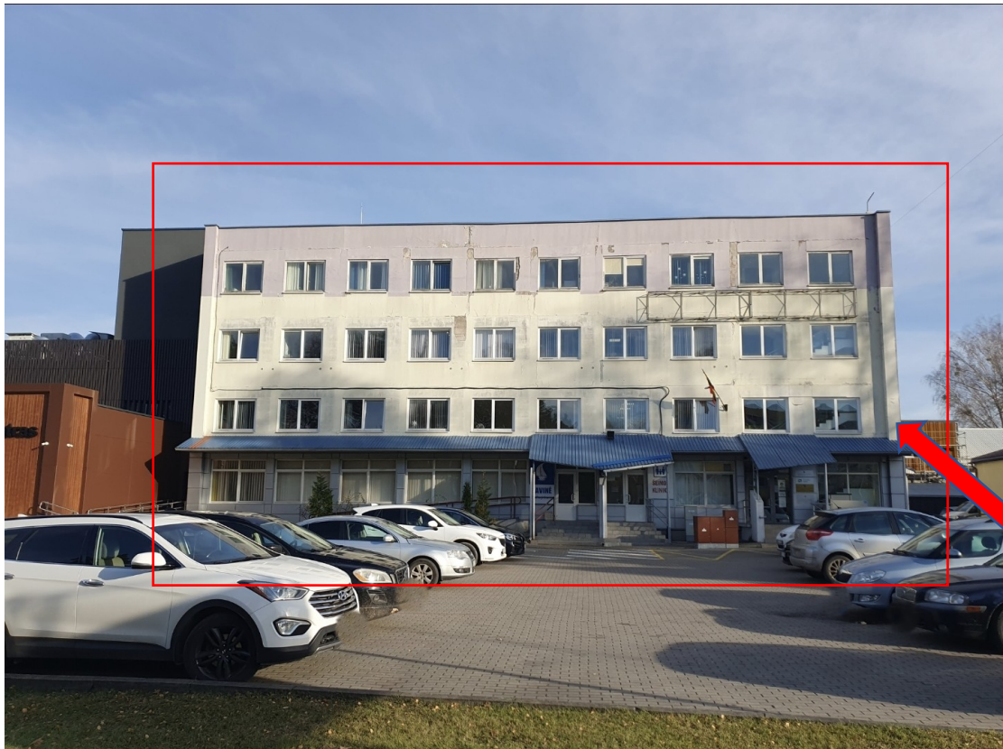
Fotonuotrauka Nr. 1 Remontuojamas Administracinis pastatas (unikalus Nr. 5197-5008-3020), S. Daukanto g. 19, Kazlų Rūdoje, pažymėtas raudonu kontūru. Vaizdas iš vakarinės pusės nuo S. Daukanto gatvės.