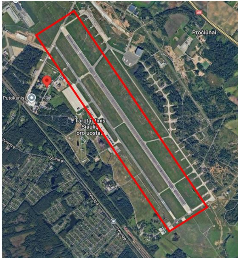
KTT dangos remonto schema