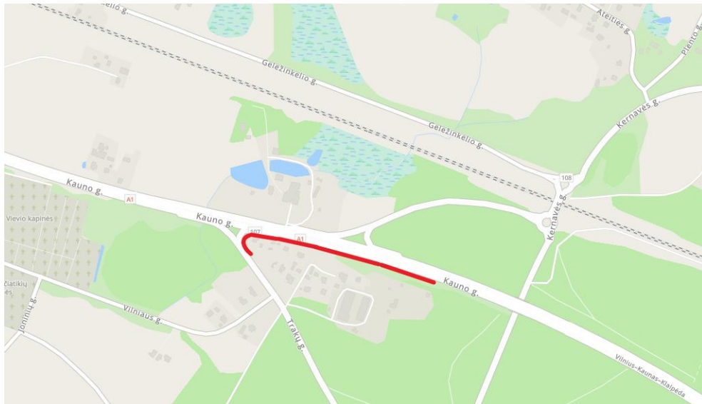
1 pav. Statinio vieta

Projektuojama triukšmo užtvara yra valstybinės reikšmės magistralinio kelio A1 Vilnius–Kaunas–Klaipėda kairėje pusėje, ruože nuo 36,6 iki 36,9 km ir baigiasi kelio Nr. 107 pradžioje (Trakų g.). Projektuojamas statinys administraciniu požiūriu yra Elektrėnų savivaldybėje, Vievio seniūnijoje. Projektuojama triukšmo užtvara atskiria gyvenamosios paskirties sklypus ir gyvenamuosius pastatus nuo magistralinio kelio. Statinio vieta pateikta 1 paveiksle.