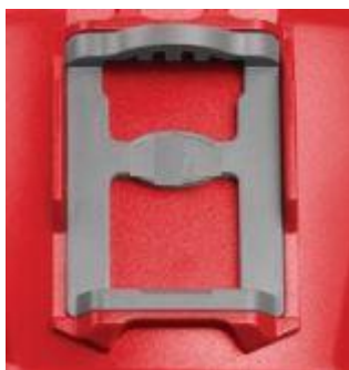
1 pav. Naktinio matymo prietaiso laikiklis.

4.2. Techninėje specifikacijoje aprašytų SOLAS šviesą atspindinčių juostų, naktinio matymo prietaiso (NVG) laikiklio, adapterio ir krepšio rankenų bei petnešų pavyzdžiai pateikiami žemiau esančiuose paveiksluose (žr. 1–9 pav.).