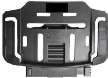
8 pav. Adapteris prožektoriumi.