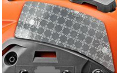
6 pav. Velcro® kibi juosta esanti šalmo šone.