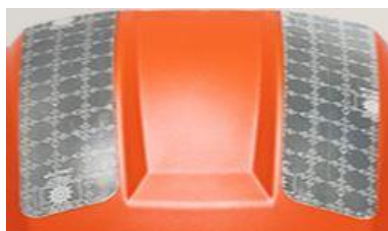
2 pav. Dvi juostos viršutinėje šalmo dalyje.