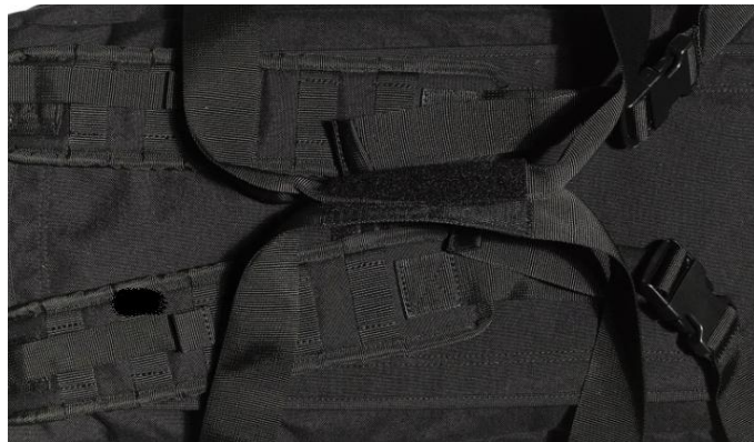
9 pav. Krepšio rankenos ir petnešos.