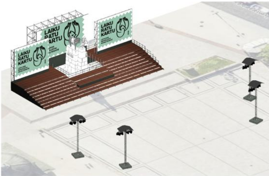
Pav. 1.3: Apšvietimo bokštų išdėstymo vaizdas iš viršaus