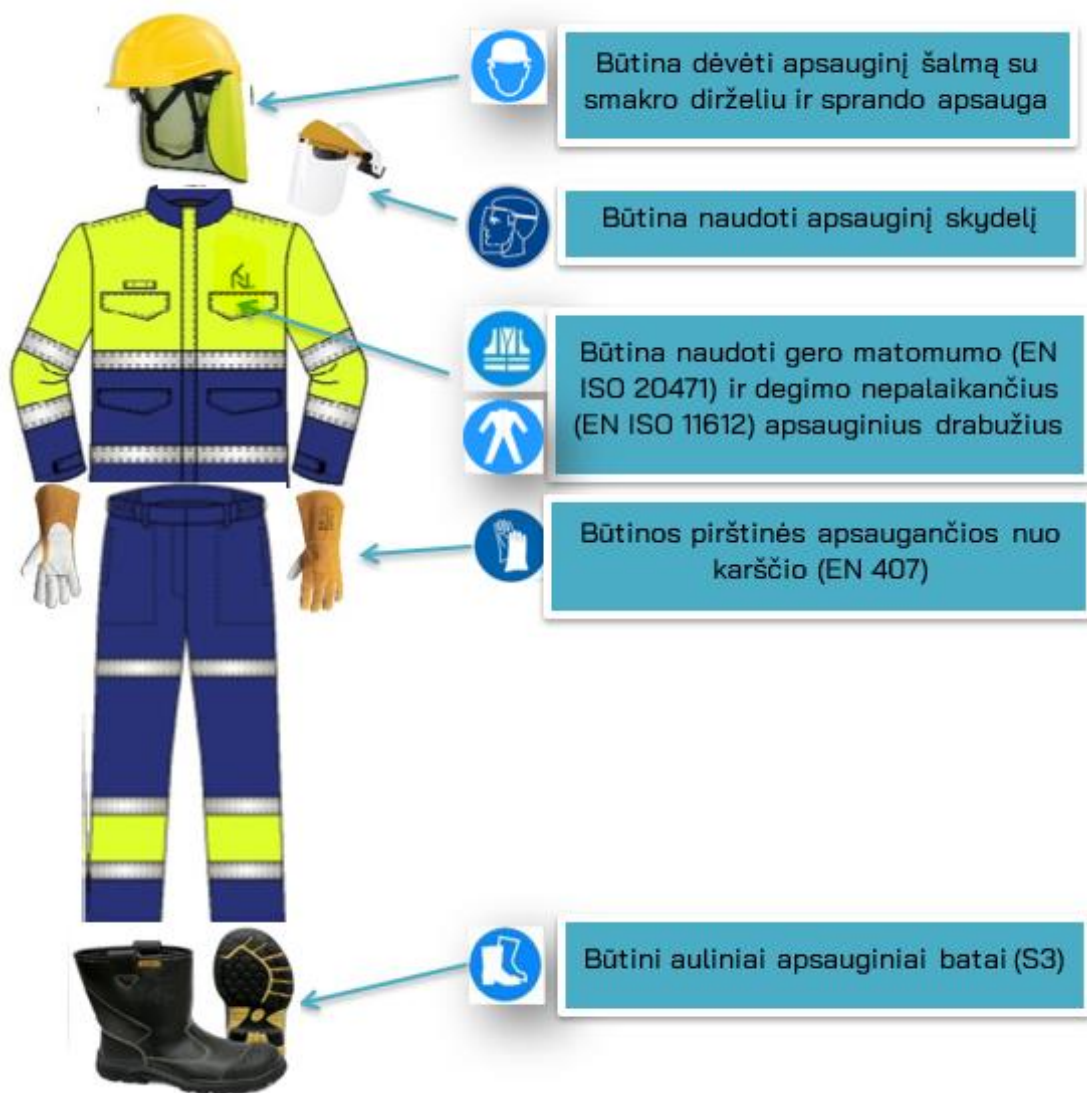
3 pav. Būtinos AAP bitumo krovos metu, patenkant į KN technologinius objektus ( neįskaitant patekimo į potencialiai sprogia aplinką )