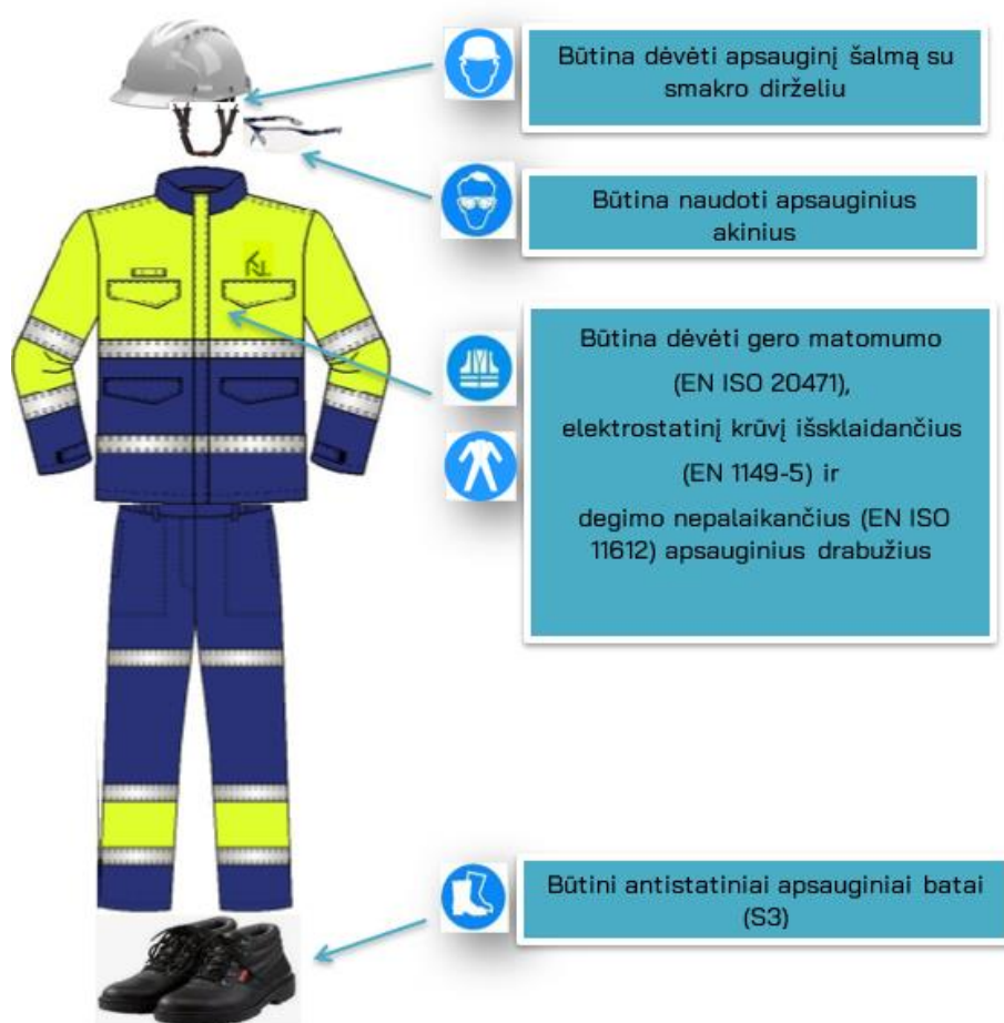
2 pav. Būtinės AAP, patenkančios į KN technologinius objektus ( įskaitant patekimą į potencialiai sprogia aplinką )