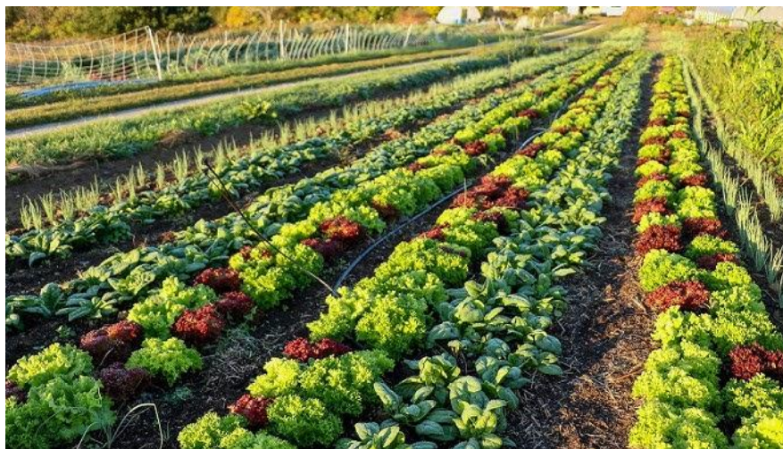
Bazilikai ir salotos daugiakomponentiniame pasėlyje