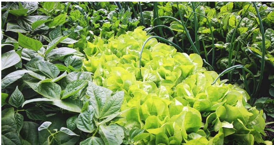
Pupelės ir salotos daugiakomponentiniame pasėlyje

Ankštiniai augalai gali būti laikomi gera alternatyva mišriųjų kultūrų auginimo sistemose, siekiant padidinti dirvožemio derlingumą ir biologinę įvairovę, kartu gerinant augalų derlių ir mažinant trąšų naudojimą (Marcos-Pérez ir kt., 2023).