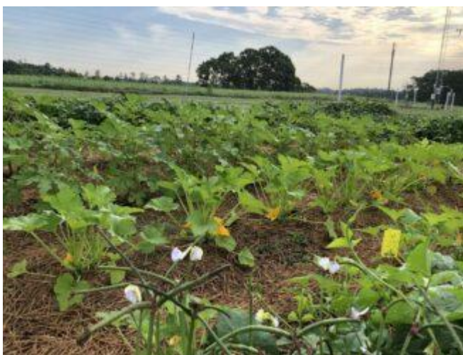
Cukinijos daugiakomponentiniame pasėlyje

Mišriuose daržovių pasėliuose dažnai auginamos ne tik dažovės, bet ir gėlės, prieskoniniai augalai, kurie ne atlieka svarbias ekologines funkcijas, bet ir praturtina bioįvairovę. Ši praktika, dar vadinama integruota kenkėjų kontrole, padeda sukurti subalansuotą ir atsparesnę agroekosistemą. Šie augalai atlieka svarbų vaidmenį gerinant bendrą agroekosistemos sveikatą, įskaitant kenkėjų kontrolę, naudingų vabzdžių pritraukimą, dirvožemio gerinimą.