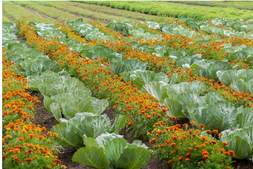
Kopūstai mišinyje su serenčiais

Daržovės bus sodinamos daigais arba sėjamos. G arba PA sodinami daigais. Vienoje iš lysvių bus sodinama ar sėjama viena pasirinkta daržovė, kaip kontrolinis variantas. Kitose lysvėse ši daržovė bus auginama daugiakomponentiniuose mišiniuose su kitų šeimų daržovėmis bei G ar PA.