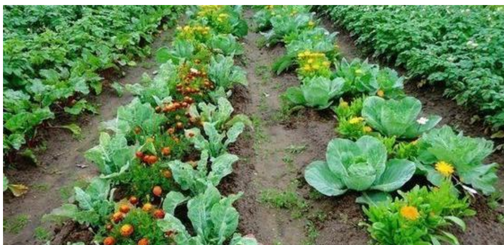
Serenčiai, medetkos ir kopūstai daugiakomponentiniame pasėlyje

Mišriuose daržovių pasėliuose dažnai auginamos ne tik dažovės, bet ir gėlės, prieskoniniai augalai, kurie ne atlieka svarbias ekologines funkcijas, bet ir praturtina bioįvairovę. Ši praktika, dar vadinama integruota kenkėjų kontrole, padeda sukurti subalansuotą ir atsparesnę agroekosistemą. Šie augalai atlieka svarbų vaidmenį gerinant bendrą agroekosistemos sveikatą, įskaitant kenkėjų kontrolę, naudingų vabzdžių pritraukimą, dirvožemio gerinimą.