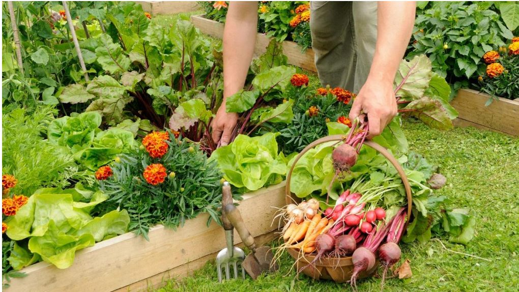
Daugiakomponentinis pasėlis pakeltoje lysvėje

5. Substrato paruošimas. Lysvės užpildomos substratu, kuris ruošiamas naudojant kompostą bei vietinį dirvožemį. Komposto ir vietinio dirvožemio santykis priklausys nuo to, kokia bus nustatyta esamo dirvožemio kokybė.