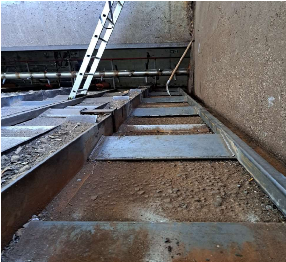
4. Sandėlio vaizdas (po pervai atlikto dalinio remonto).