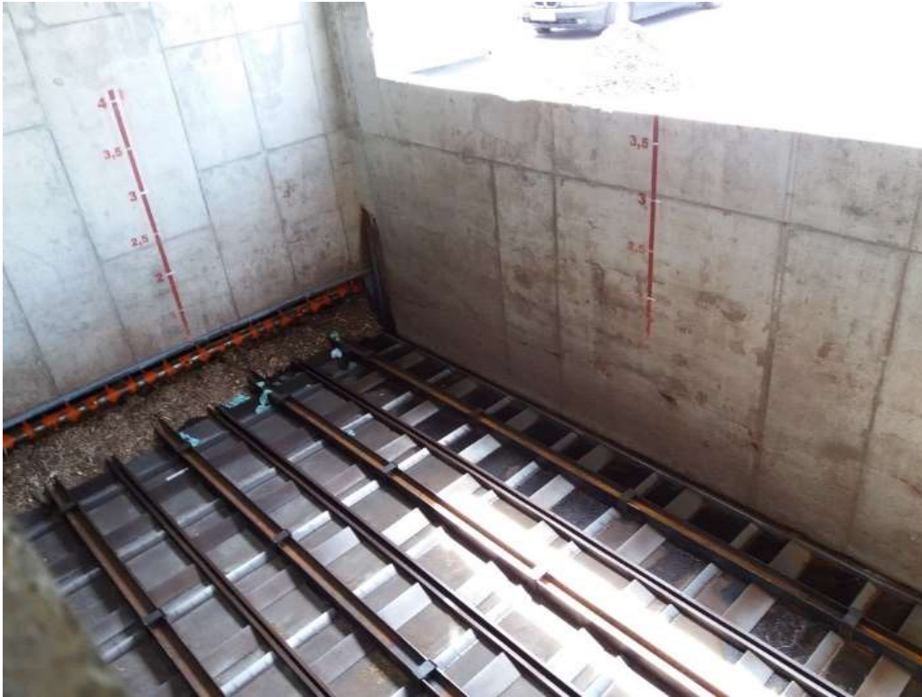
3. Bendras sandėlio vaizdas.

Mažos vertės Ventos miesto katilinės biokuro sandėlio rekonstrukcijos darbų pirkimo, vykdomo skelbiamos apklausos būdu, sąlygos