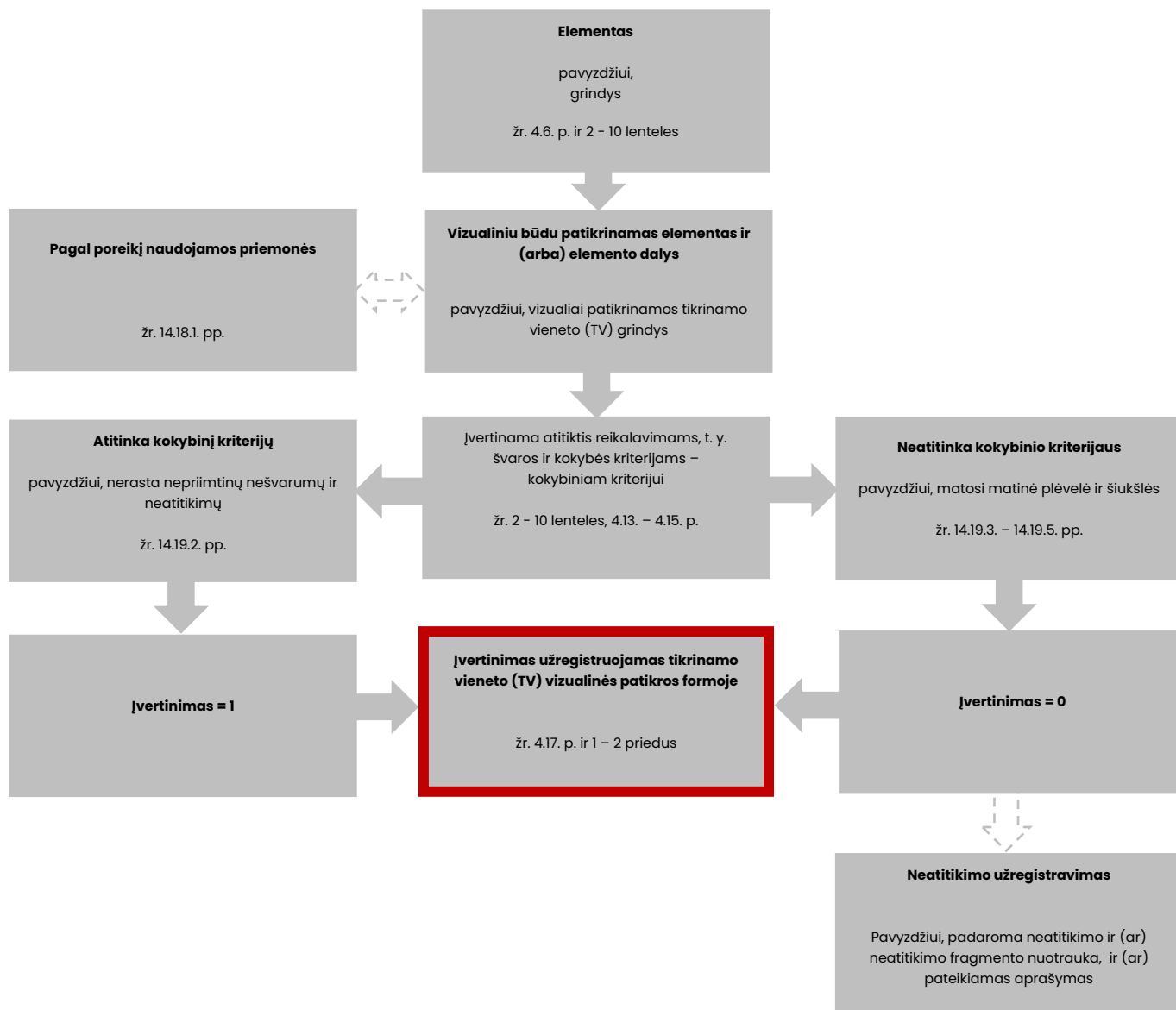
2 schema. VVK. Elemento vizualinio atitikties įvertinimo reikalavimams procesas